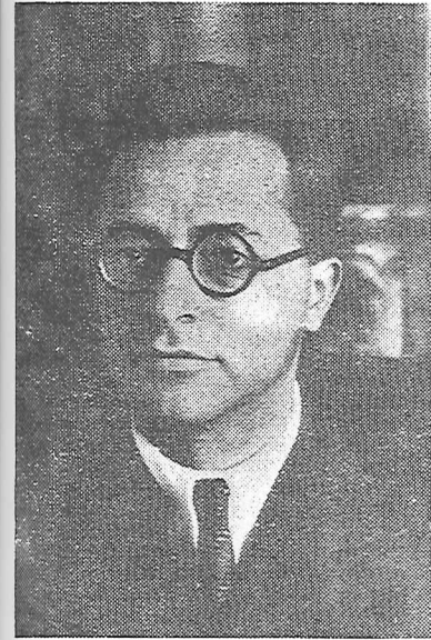
Palmiro Togliatti (Ercoli)

Stato Operaio , quale « rassegna di politica proletaria », pone al centro della sua attenzione: come, con quali mezzi, attraverso quali vie la classe operaia e il popolo italiano possono raggiungere la loro liberazione politica ed economica.