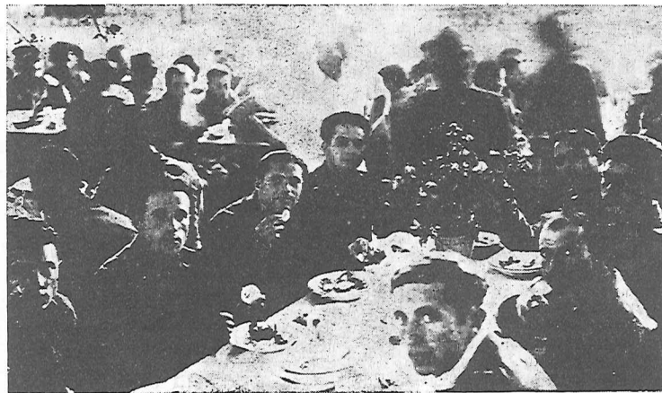
Prigionieri italiani a mensa in una caserma di Valenza

Confrontino gli italiani, confrontino anche i fascisti in buona fede, le parole di Regime Fascista e quelle del Comandante del Battaglione Garibaldi. Da quale parte stanno i veri italiani?