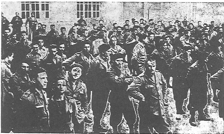
Prigionieri italiani nel cortile di una caserma di Valenza

Questa è la verità, che il fascismo tenta di nascondere agli italiani e che, appunto per questo, i comunisti e tutti gli antifascisti devono sforzarsi di far conoscere al nostro popolo, con tutti i mezzi, così come devono sforzarsi, con tutti i mezzi, di far comprendere al nostro popolo che la lotta in difesa della Repubblica democratica spagnola non può, per esso essere separata dalla lotta, in Italia, per la conquista della democrazia; della lotta, in Italia, contro il regime fascista, per il pane, la pace e la libertà.